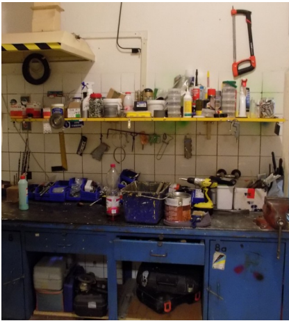
Pracovní prostředí STP

Občas opomíjená složka SLEZSKÉ HUMANITY, obecně prospěšné společnosti jsou naši kluci údržbáři, někdy v našich zařízeních malují, opravují, sekají trávu a starají se o naše zahrady, jindy převážejí klienty nebo pracovníky služebním vozem. A pokud pořádáme výlet potřebujeme je jako řidiče mikrobusu. Ať už pracují na zahradě, nebo jindy ve své dílně spravují co se dá ještě použít a nemusí se kupovat nové, vždy když je potřeba, tak je voláme a bombardujeme požadavky.